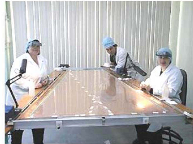
Soldering wires onto the anode panel Пайка анодных панелей