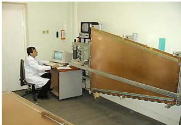
Checking of anode panel for wires pitch & tension Тестирование анодных панелей