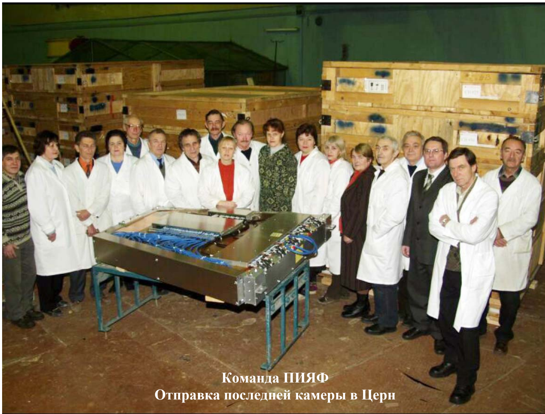
Команда ПИЯФ Отправка последней камеры в Церн