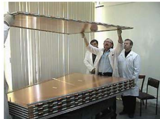
Assembly of CS chamber Сборка камеры