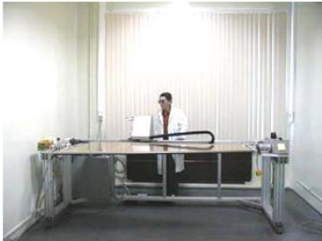
The operation of winding the wire round the panel Намотка проволоки на анодную панель