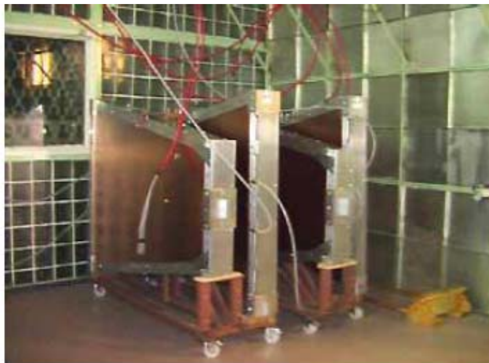
Long-term HV testing of CSCs Камеры на долговременном высоковольтном тесте