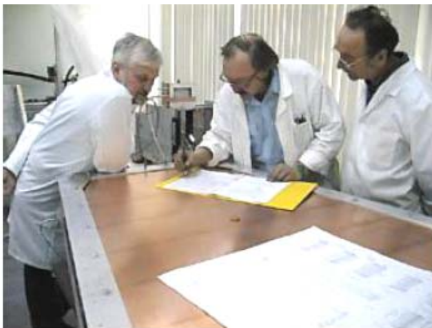
The test is completed Тестирование камеры