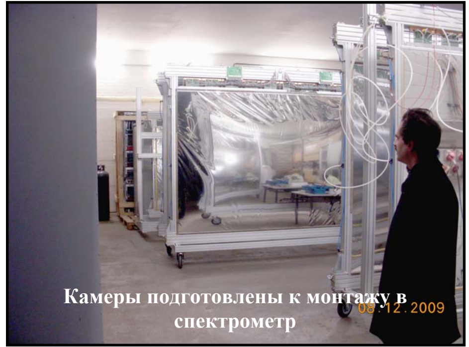
Камеры подготовлены к монтажу в спектрометр