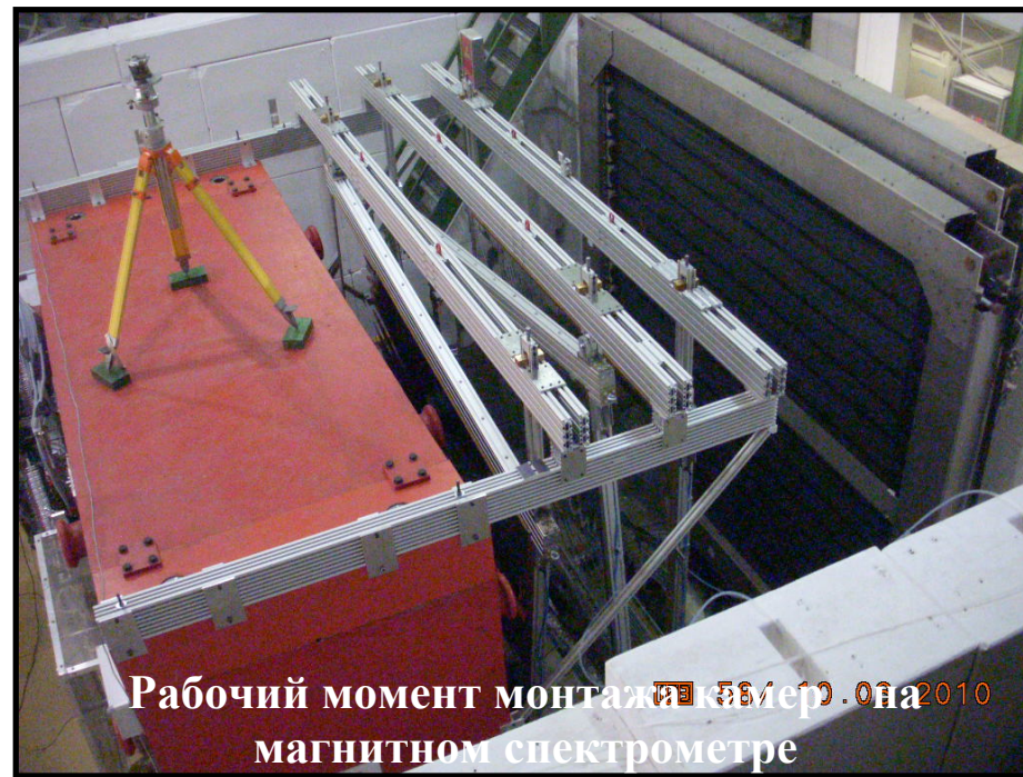
Рабочий момент монтажа камер на магнитном спектрометре