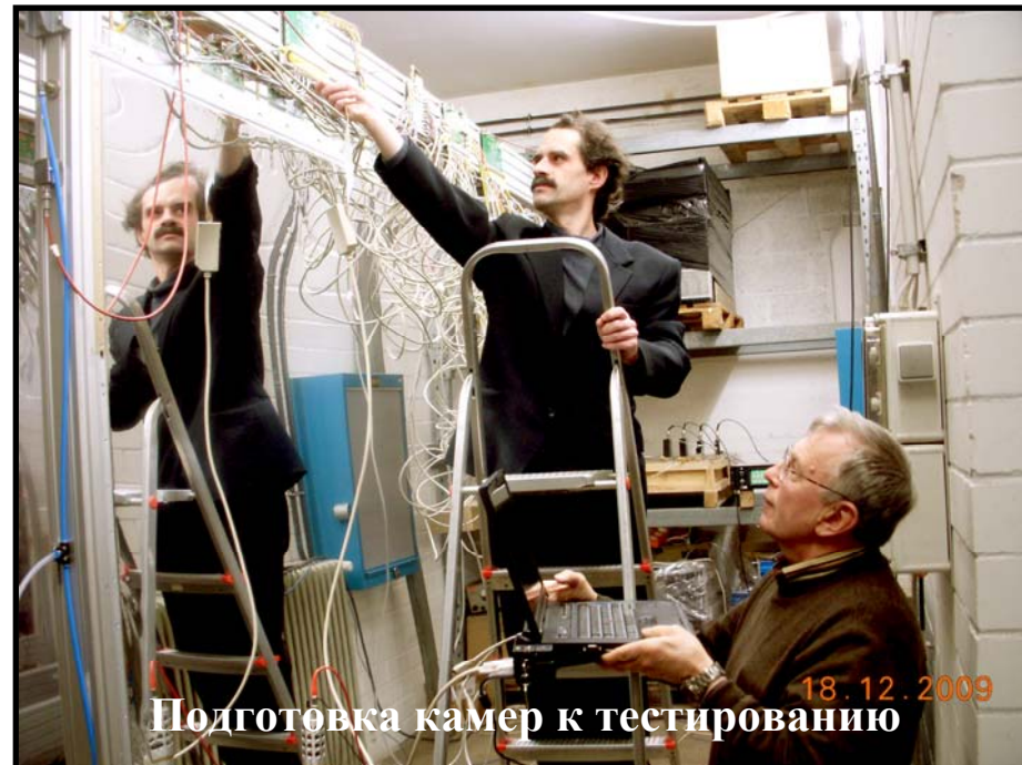
Подготовка камер к тестированию