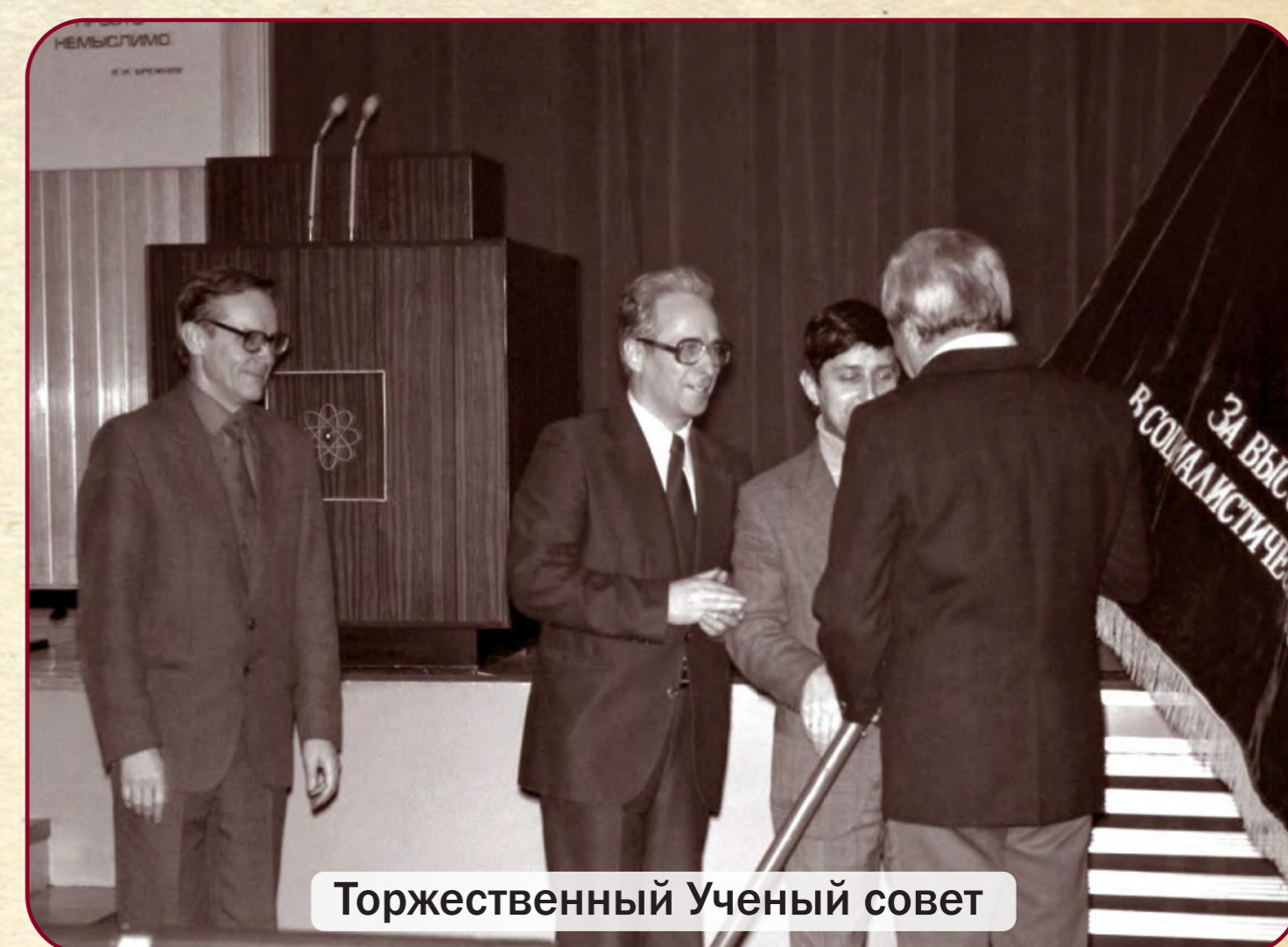
Торжественный Ученый совет