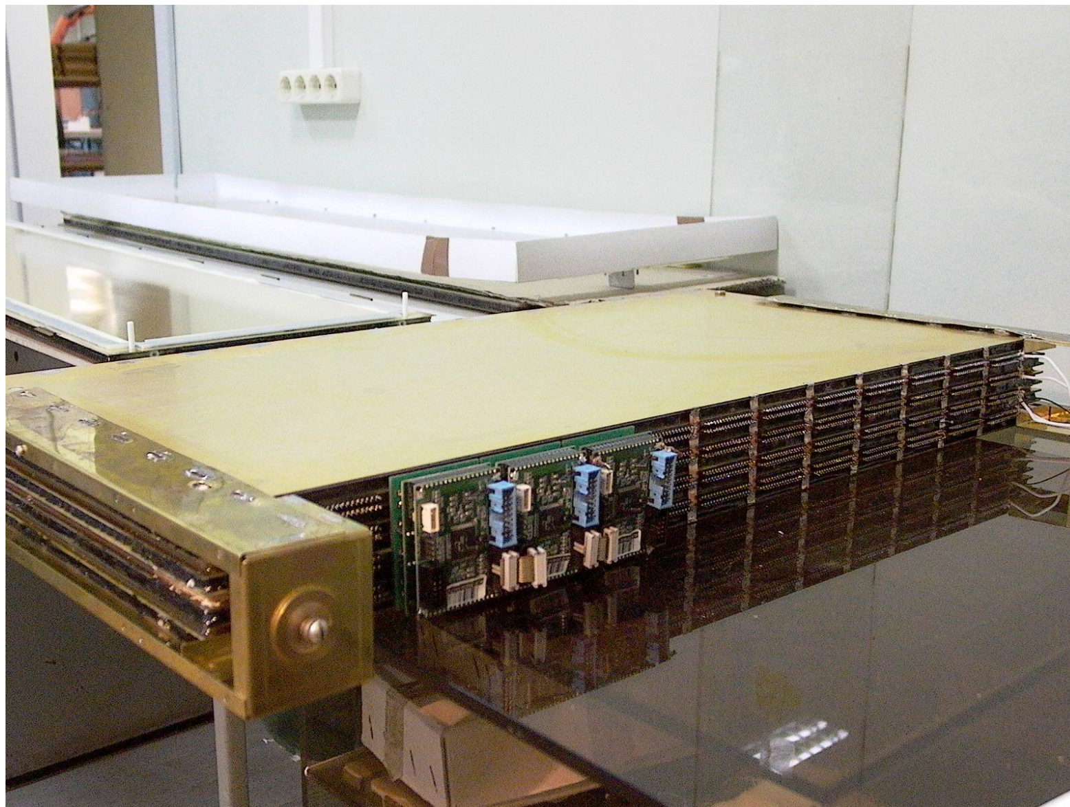
Мюонная камера M2R2